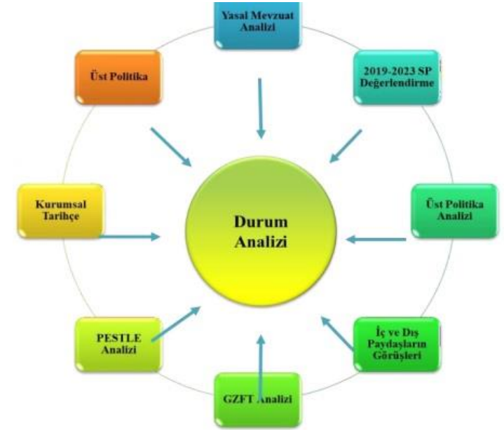
Şekil-1 Durum Analizi

Müdürlüğümüz Stratejik Plan Ekibi Şekil-1’de belirtilen modele göre Durum Analizi çalışmalarını tamamlamıştır. Stratejik Plan Hazırlık Süreci bölümünde Merkezimizin 2024-2028 Stratejik Planının oluşturulma sürecine yön veren hazırlık programı ile Strateji Geliştirme Kurulu ve Stratejik Plan Ekibine yer verilmiştir.